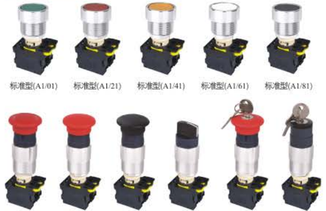
标准型(A1/01) 标准型(A1/21) 标准型(A1/41) 标准型(A1/61) 标准型(A1/81) 急停自锁(A3) 蘑菇型(A4/21) 蘑菇型(A4/81) 旋钮(B1) 带钥匙蘑菇型(Y0) 旋钮带钥匙(Y1)